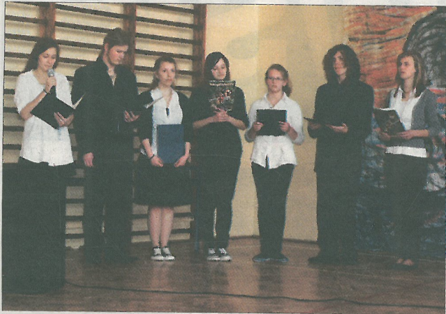
Uczniowie Gimnazjum nr 2 w Dąbrowie zaprezentowali program „Misterium Krzyża”.